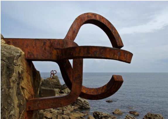
2A. E. Chillida: El peine de los vientos . 1976.