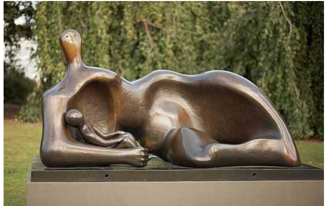
2B. Henry Moore. Madre e hijo reclinados . Bronce