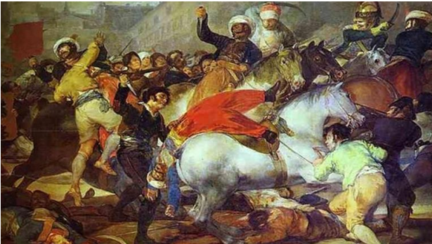
2A. F. Goya: La carga de los mamelucos . 1814.