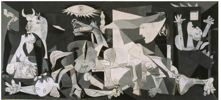
2B. P. Picasso: Guernica . 1937.