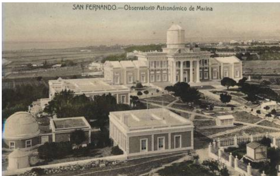
REAL OBSERVATORIO a principios del siglo XX

Otro de los apartados más importantes del Observatorio es la Biblioteca, con miles de libros científicos, algunos de ellos de enorme valor.