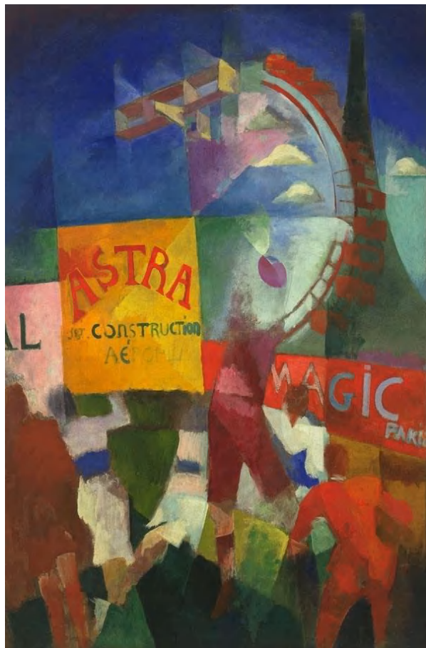
"L'Équipe de Cardiff"