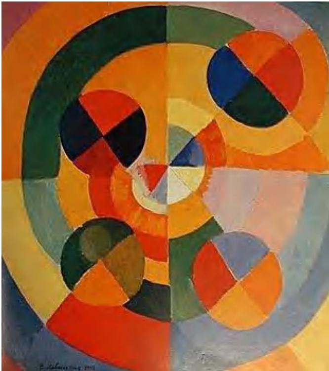
"La alegría de vivir"