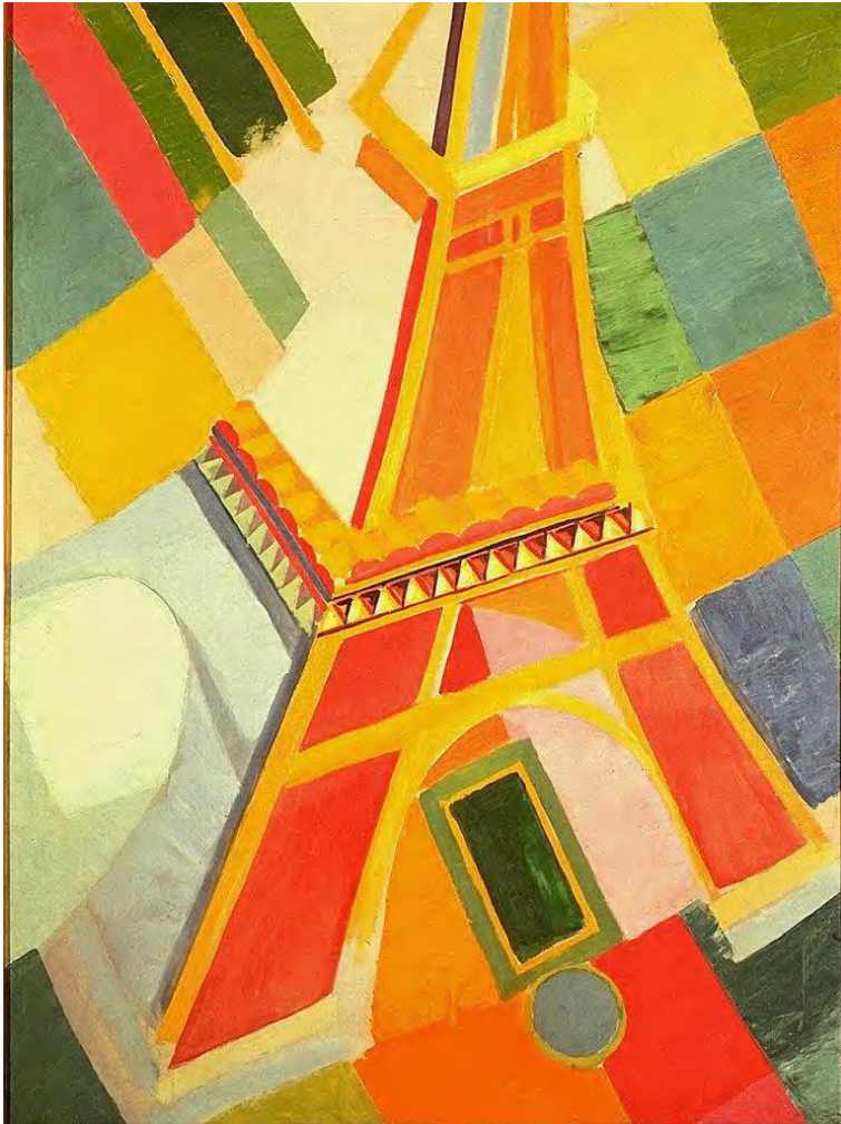
“La Torre Eiffel”

-Descomposición de las figuras en partes geométricas