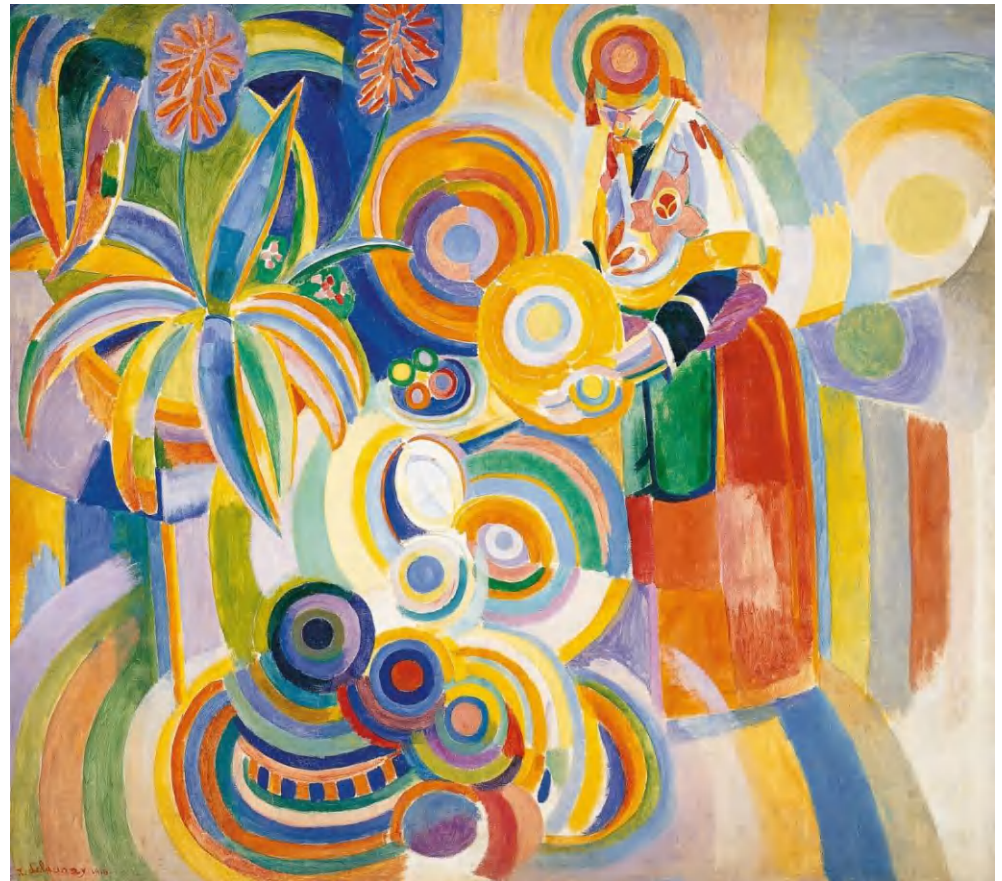
“La gran portuguesa”