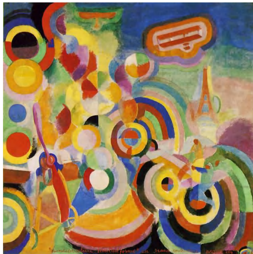
"Homenaje a Blériot"