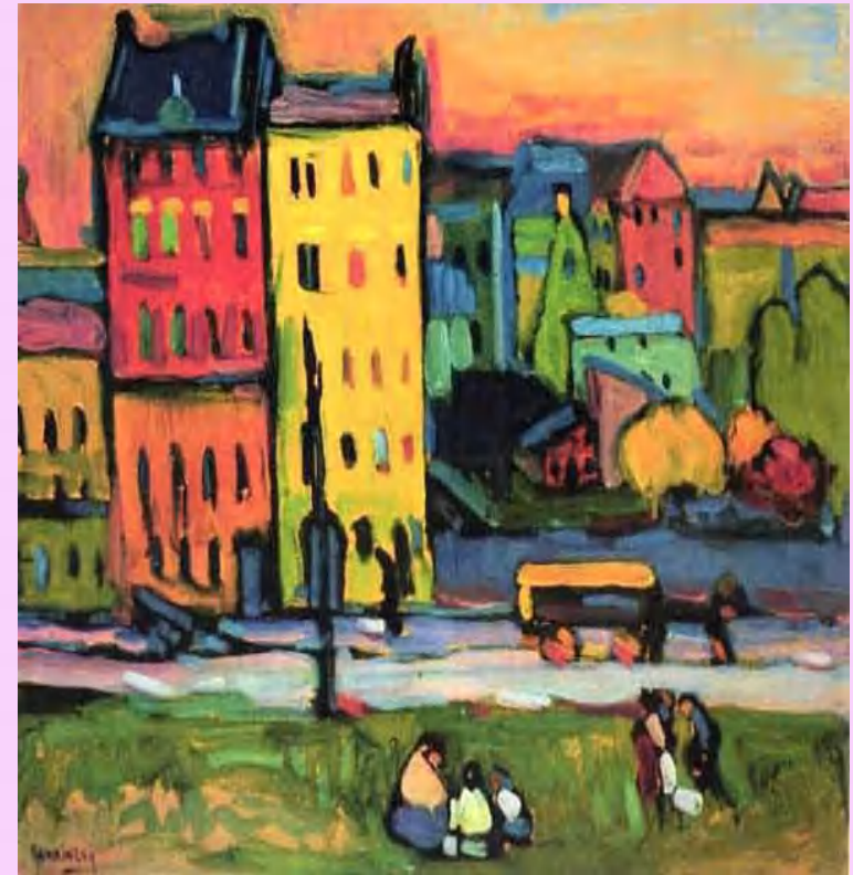
Casas en Munich