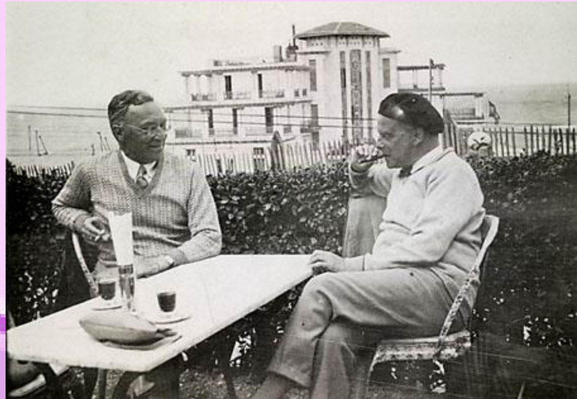
Maestros de la Bauhaus