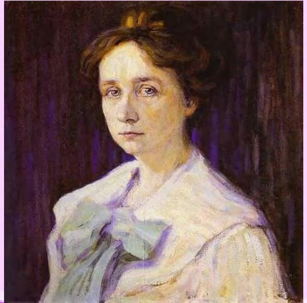
Retrato de Gabriel Münter (1905)