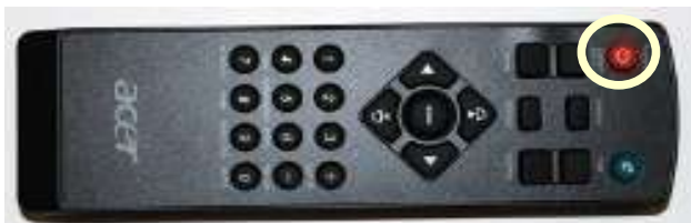
MANDO: Botón encendido/apagado

1-Encender el CAÑÓN PROYECTOR, pulsando el botón encendido/apagado en el mando a distancia o en el cañón.